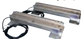
Paire de barres de charge 0,60 m, 2x750 kg