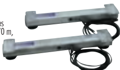
Paire de barres de charge 0,99 m, 2x1250 kg compatible avec les cages de contention et de manipulation.